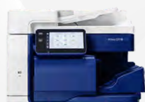
FINALIZADOR INTERNO A2