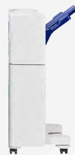
FINALIZADOR B4 12