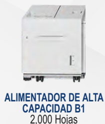
ALIMENTADOR DE ALTA CAPACIDAD B1 2,000 Hojas