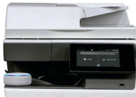
MX-C304W se muestra con la función de Voz MFP de Sharp disponible con la tecnología Alexa.

"Alexa, pide a la copiadora Sharp que escanee para mí".