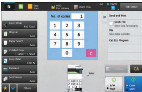
La Pantalla de Copiado estándar ofrece funciones más avanzadas.