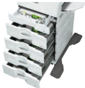
Ambos modelos ofrecen hasta seis fuentes de papel para una capacidad máxima de 2,700 hojas (se muestra con bandejas opcionales).

Desde el manejo del papel hasta la conexión en red, los sistemas compactos de documentos a color MX-C303W y MX-C304W excederán sus expectativas.