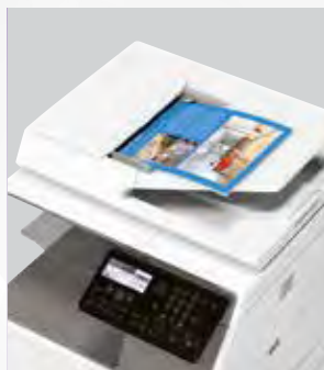
Digitalización en red a todo color