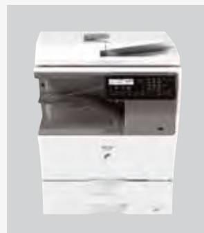
Configuración de escritorio