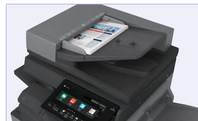
RSPF de 100 Documentos escanea documentos a una velocidad de hasta 80 imágenes por minuto.