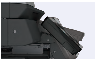
Pantalla táctil móvil ofrece el ángulo de visión para cualquier uso al instante.