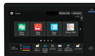
Pantalla táctil customizable de 10.1" (medida diagonalmente).