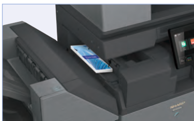
La nueva opción de unidad de plegado interior ofrece una variedad de patrones de plegado, incluidos plegado triple, plegado en Z y otros.